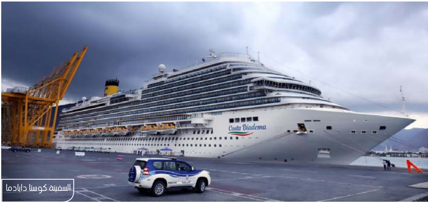
السفينة كوستا دايادما